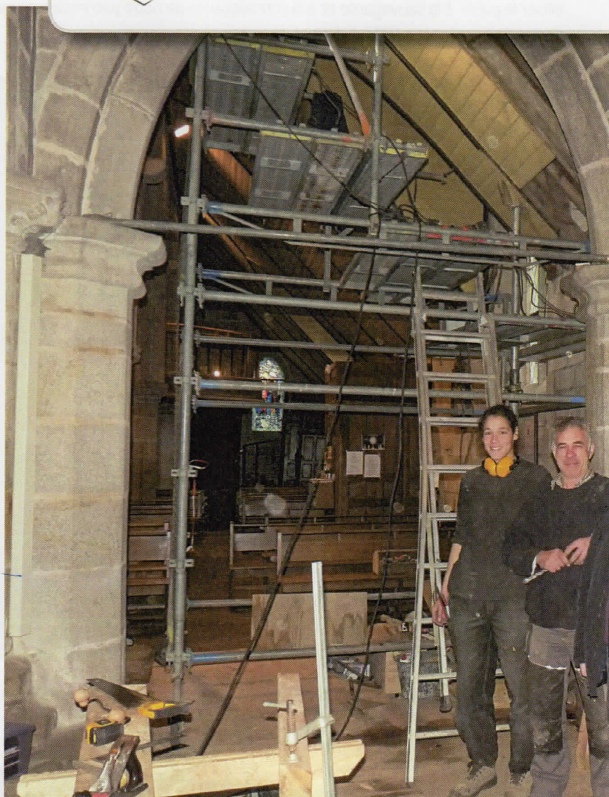
Décembre 2018 - Réfection de la couverture et de la charpente pour la mise hors d'eau de l'édifice.

ASSOCIATION DE SAUVEGARDE DE NOTRE DAME DE ROSPORDEN